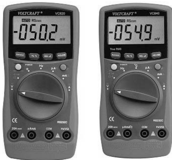
VC 820 und VC 840